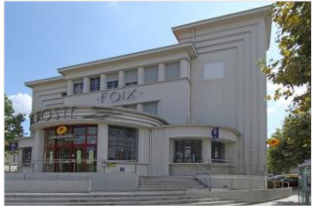
Hôtel des postes de Foix- 1947

Sur les opérations, une part d'accompagnement social est prévue pour avoir des retombées positives sur l'environnement immédiat. par exemple, pour le chantier de la Porte d'Orléans, un travail de suivi photographique du chantier a été initié avec des élèves en échec scolaire du quartier accompagnés par des photographes de l'agence Magnum.