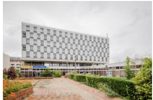
Poste de Cergy – 1978