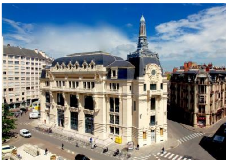
Hôtel des postes de Dijon – 1910

Les paris de La Poste sont différents selon les époques, l'évolution de la technologie, l'évolution sociétale et industrielle, et l'écriture architecturale traduit « vers où nous allons ».