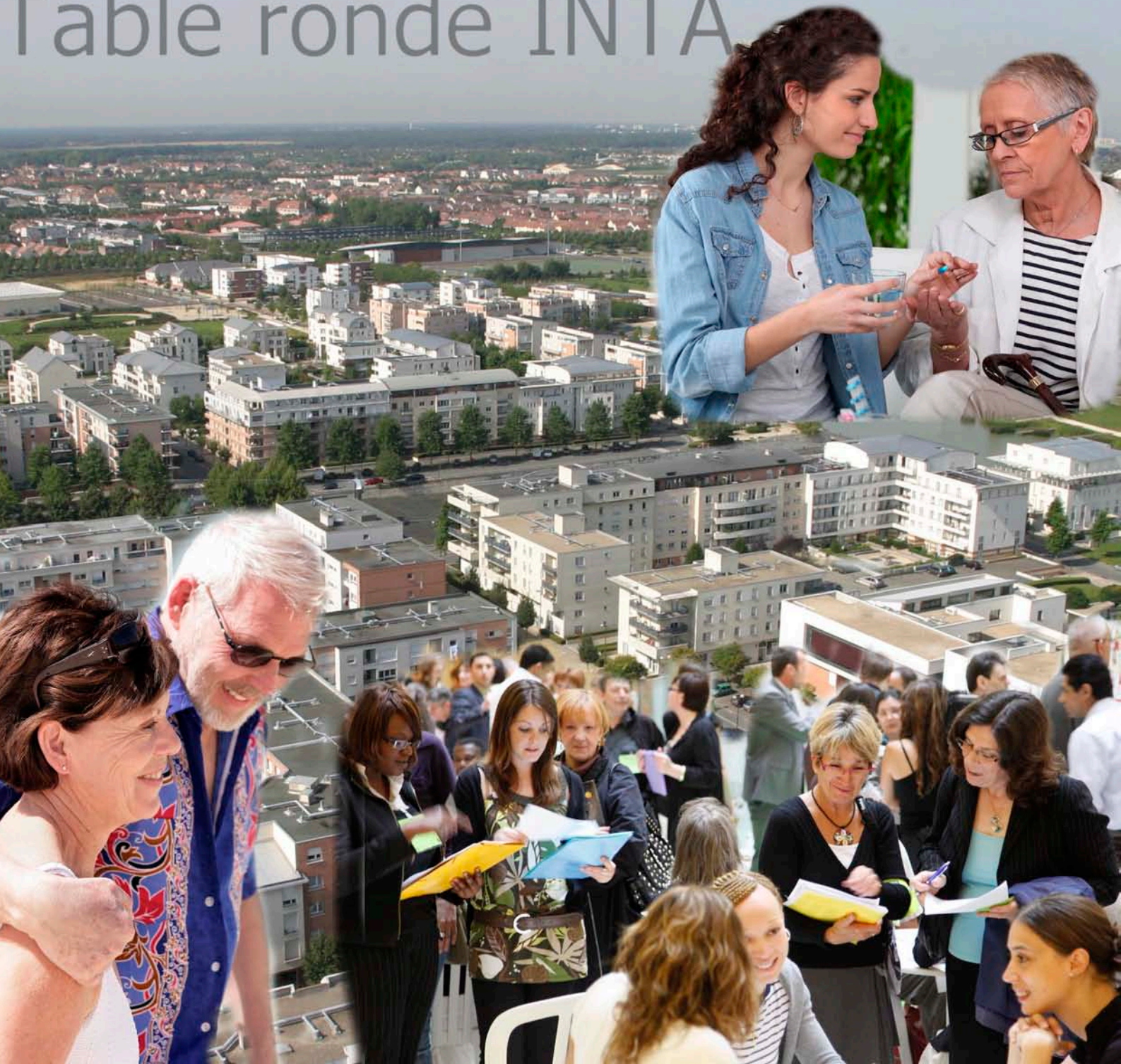
Table ronde INTA

SAINT-QUENTIN EN YVELINES, 6-7 AVRIL 2011