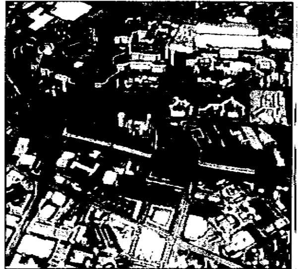
Au cœur de ce conseil municipal extraordinaire : l'esquisse d'un projet urbain le long de la rocade Sud, des Essarts jusqu'à la limite avec Eybens. Document Ville d'Echiroles