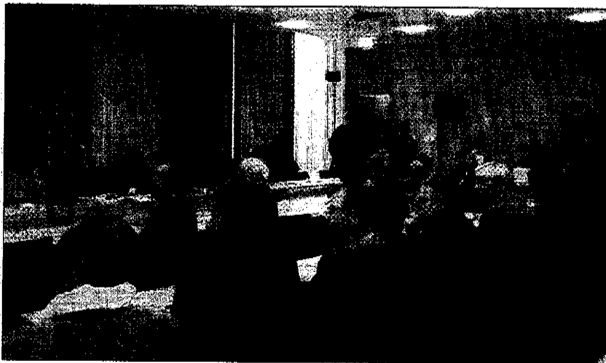
Le projet de renouvellement urbain Novasud est sorti conforté de son analyse par des experts internationaux.