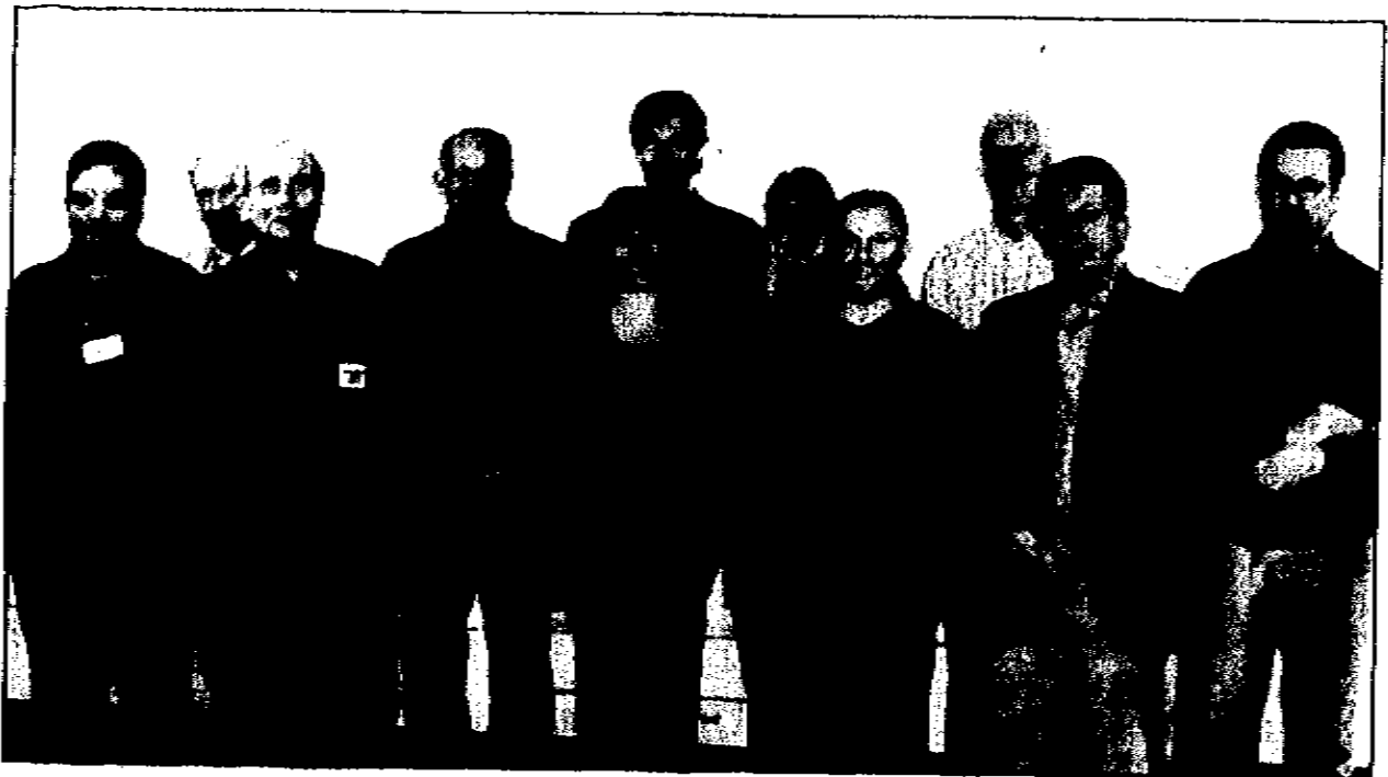
Une partie des experts qui vont se pencher sur le projet Novasud 21 cette semaine et leur traducteur (à gauche).

La ville d'Échirolles en partenariat avec la Métro, les villes d'Eybens et de Grenoble ont décidé d'explorer les perspectives d'un développement urbain et durable pour les territoires du sud de l'agglomération grenobloise. Un projet "Rocade Sud" devenu projet "Novasud 21". C'est pourquoi notamment, ils ont fait appel à un groupe d'experts internationaux du développement territorial à l'occasion d'un séminaire organisé par l'INTA (association internationale de droit français qui anime depuis 1974 un réseau de plus de 7 000 praticiens urbains dans 60 pays).